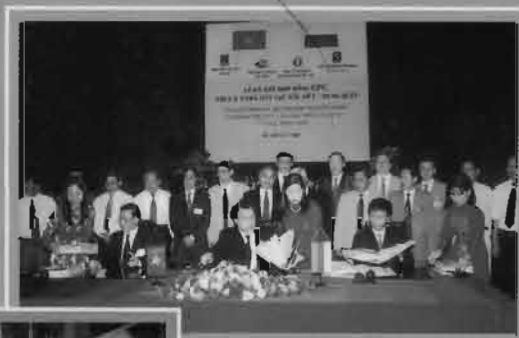
Ký kết hợp đồng 230 triệu USD cho nhà máy lọc dầu Dung Quất Signing Contract worth USD 230 million for Dung Quat Refinery Project