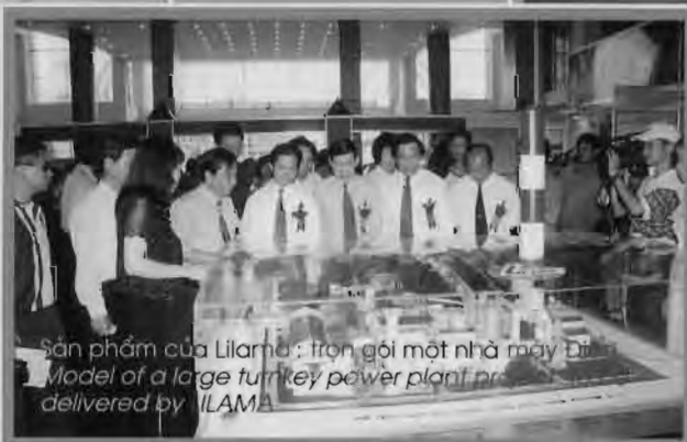
Sản phẩm của Lilama: trọn gói một nhà máy Điện Model of a large turnkey power plant project delivered by LILAMA