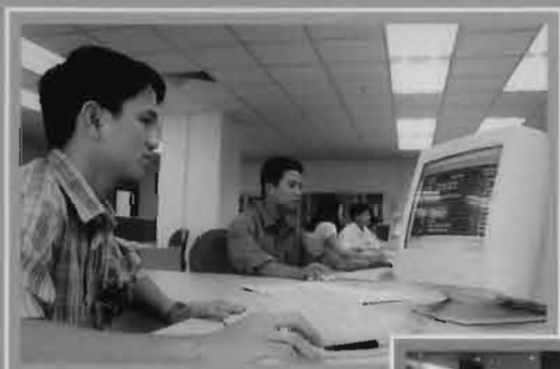
Lực lượng trí thức trẻ Công ty Tư vấn Lắp máy Competent engineers at LILAMA Consultant Company

Địa chỉ : 124 Minh Khai, Quận Hai Bà Trưng, Hà nội Tel : 84.04.8633067; 8632059 Fax : 84.04. 8638104