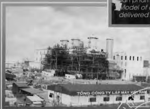
Chế tạo và lắp đặt thiết bị nhà máy Nhiệt điện Phú Mỹ LILAMA manufactured and installed major equipment for Phu My Thermal Power Plant