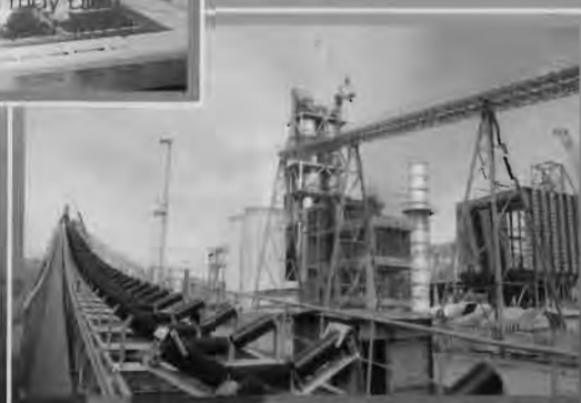
Chế tạo và lắp đặt thiết bị công nghệ nhà máy xi măng 2,3 triệu tấn/năm LILAMA manufactured and installed major equipment for the Nghi Son 2.3 million tons per year Cement Plant