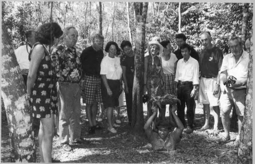
Hầm bí mật A hide out

Đến thành phố Hồ Chí Minh, các bạn hãy thăm Địa đạo Củ Chi, để hiểu thế nào là cuộc chiến đấu trường kỳ gian khổ, để hiểu đúng nguyện vọng sâu sắc của chúng tôi ngày nay là : yêu hòa bình, độc lập, hạnh phúc âm no vĩnh viễn.