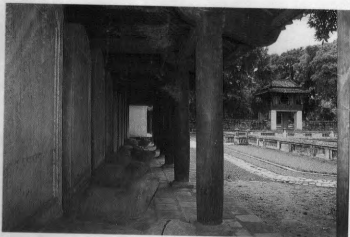
Khue Van Pavilion and stelae of laureates.

ADDRESS: VAN MIEU - QUOC TU GIAM STR., HANOI, VIETNAM TELEPHONE: 2.52917 - 2.35601