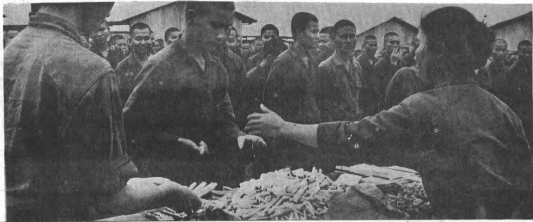
CÁC TÙ-BINH ĐANG SỐNG YÊN LÀNH, SUNG SƯỚNG VÀ ĐẦY ĐỦ TIỆN NGHI.