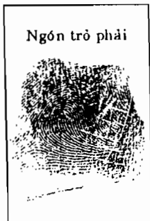
Ngón trở phải