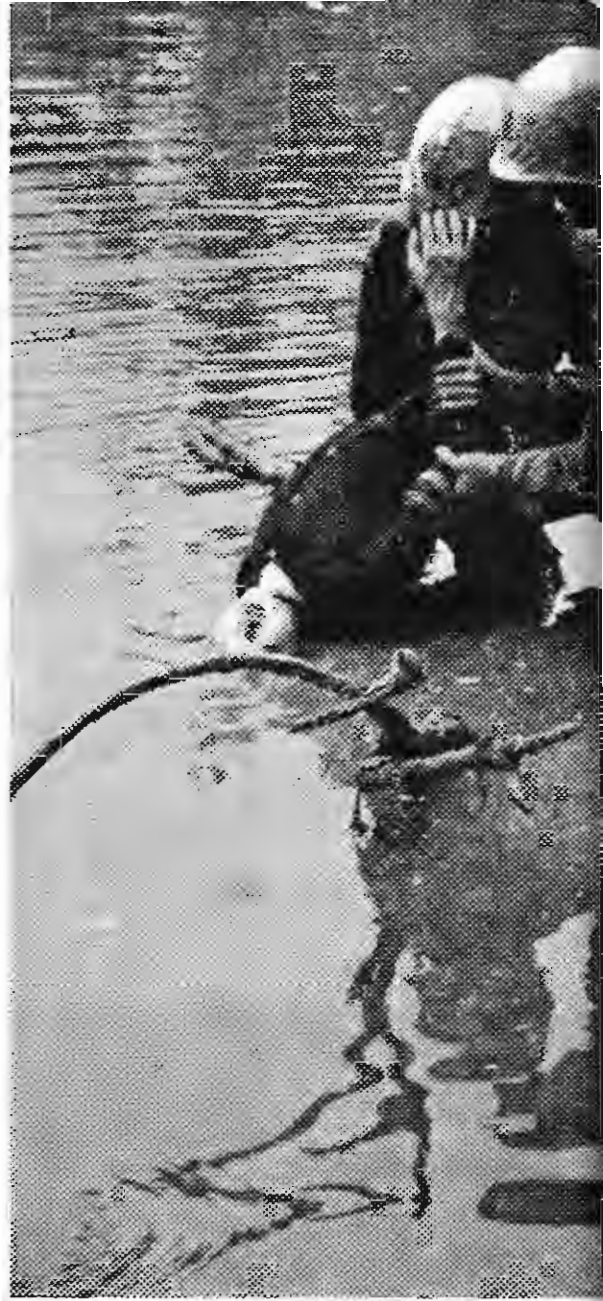
英勇不屈的婦女被美国强盜活活淹死