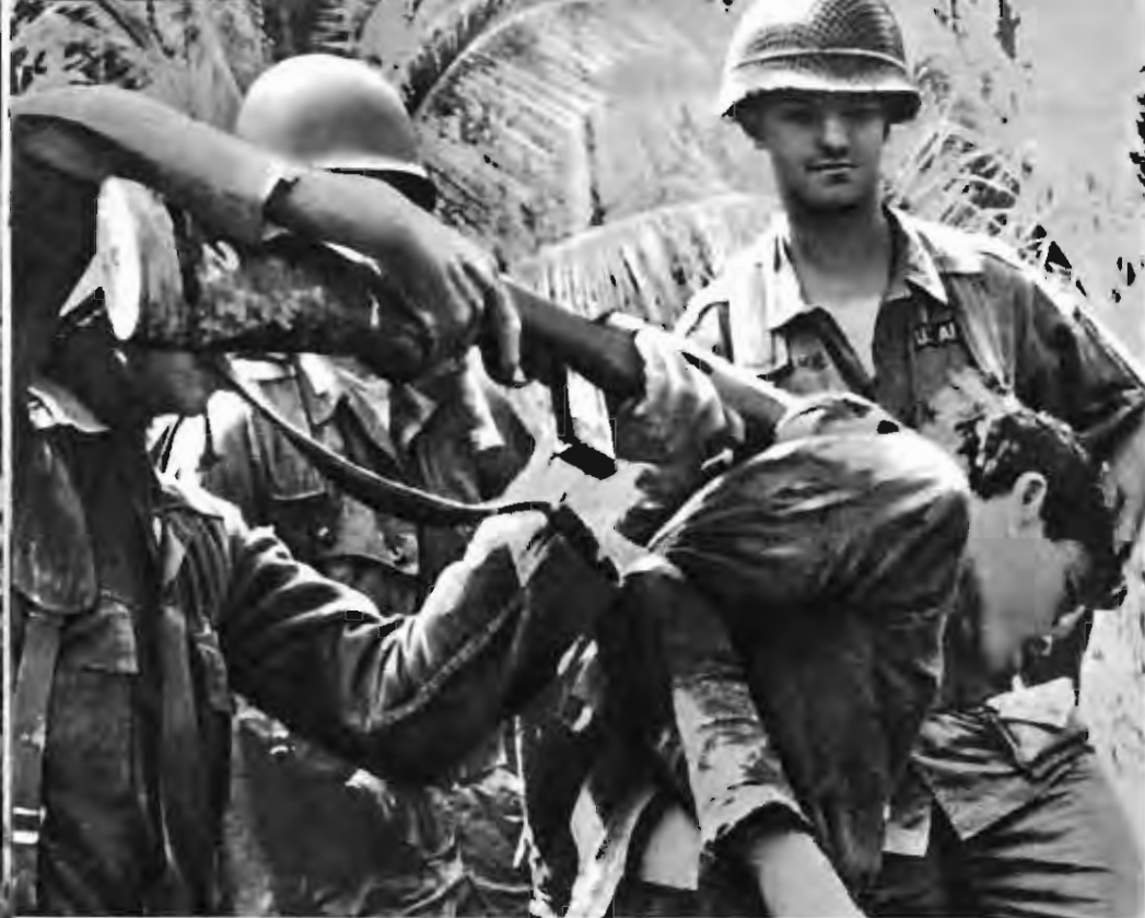
左：許多无辜村民遭到酷刑拷打