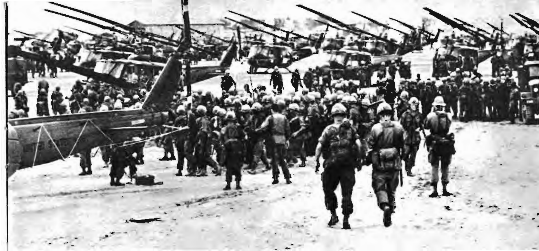
在边和机场准备起飞去屠杀南越人民的美国侵略军