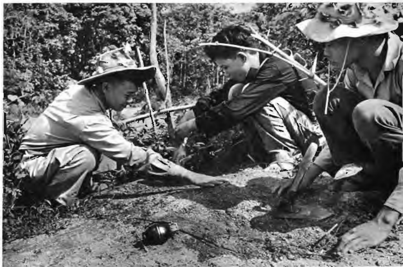
左：越南南方人民破坏敌 人的交通要道，切断 敌人的供应线，使敌 人占领的城市成为大 海中的孤岛