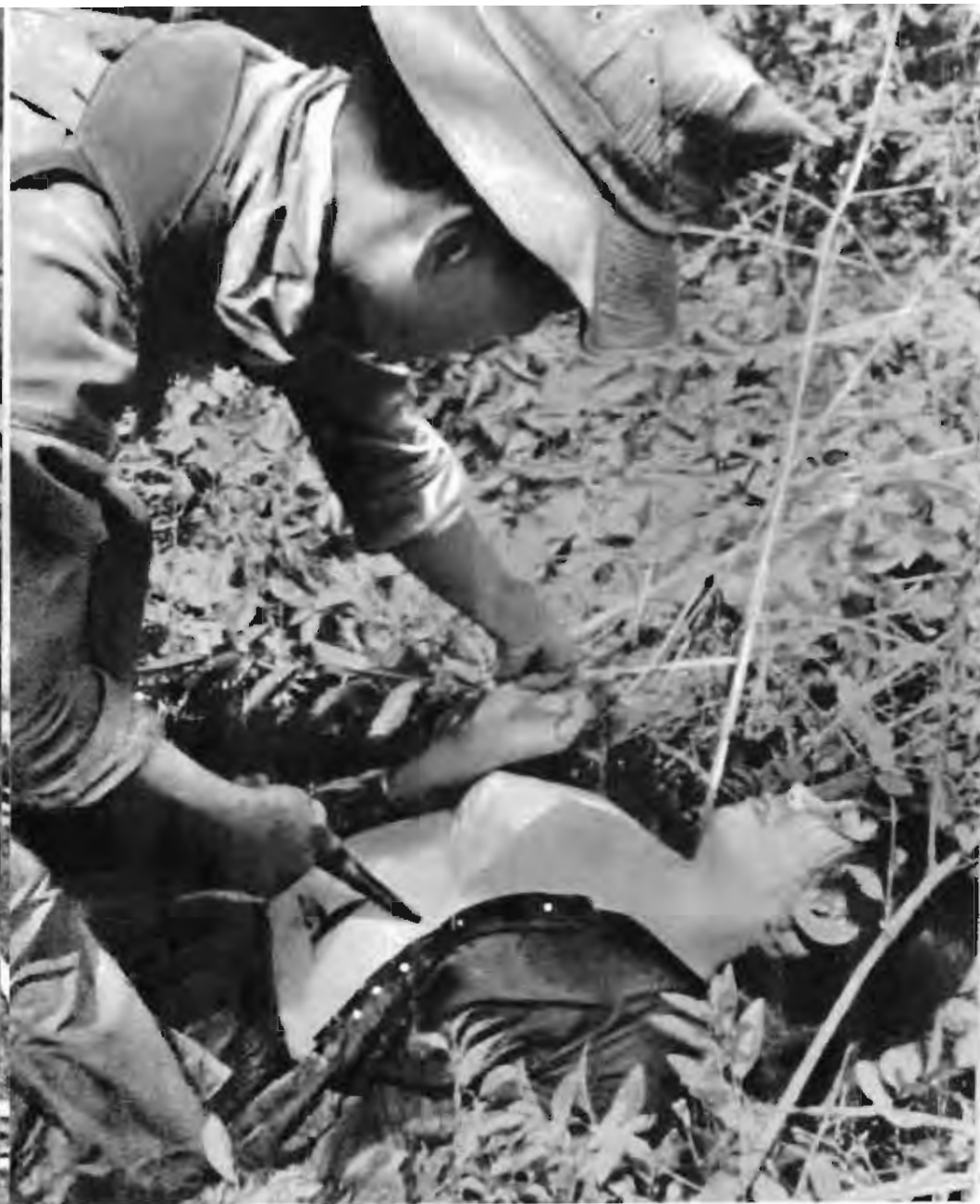
許多婦女就这样被美帝国主义 及其走狗剖腹杀害