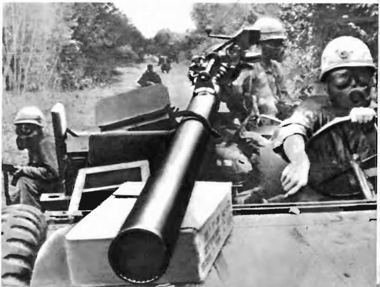
美国侵略军在西贡附近大量施放毒气