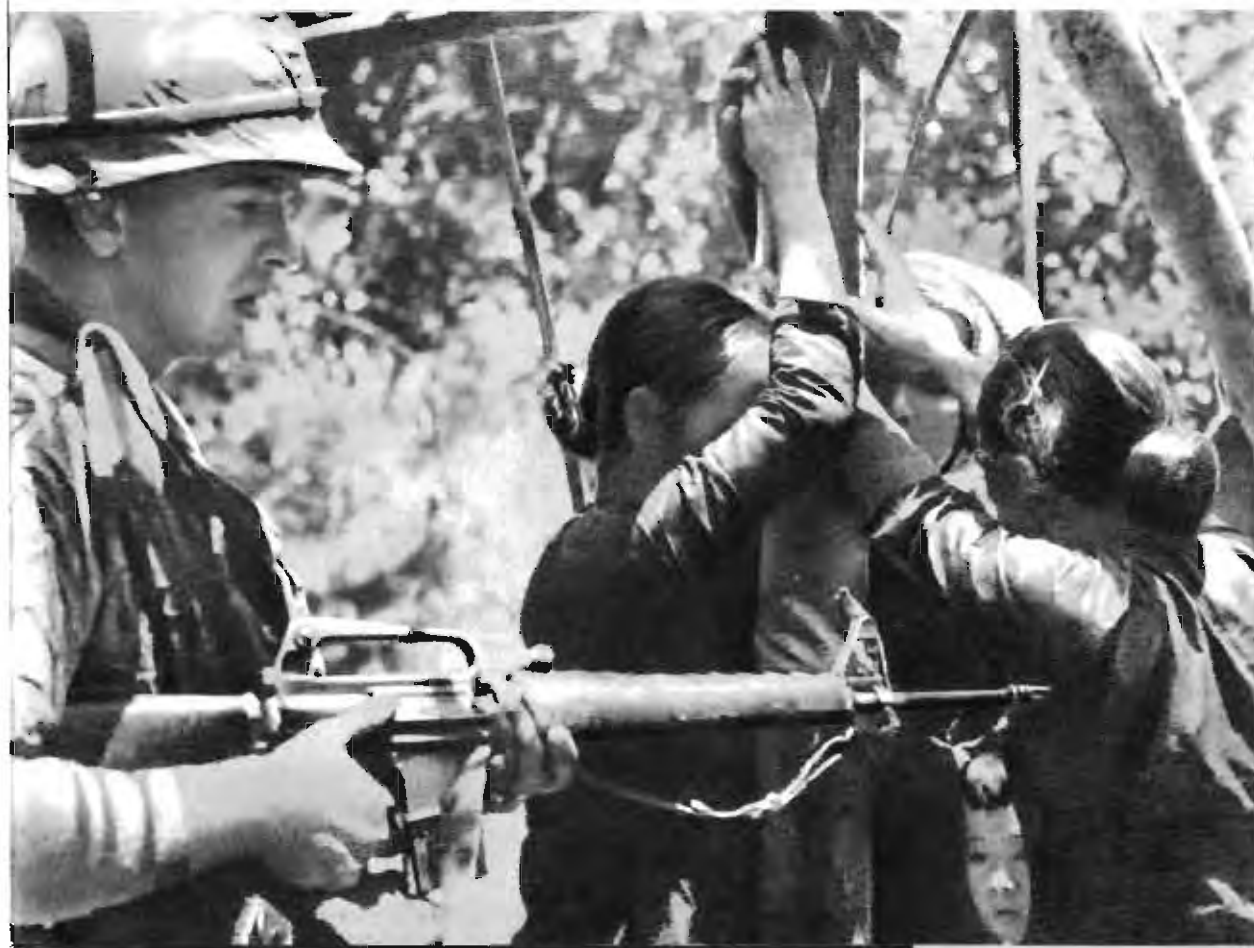
許多婦女橫遭逮捕