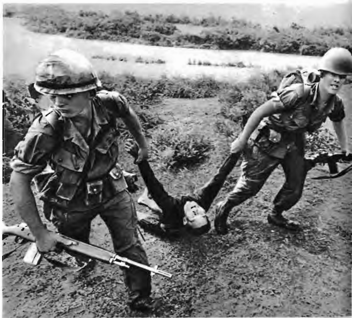
右：美国强盗在岷港附近的一次大屠杀中，杀害了五十六人。美国强盗的手上沾满了越南人民的鲜血