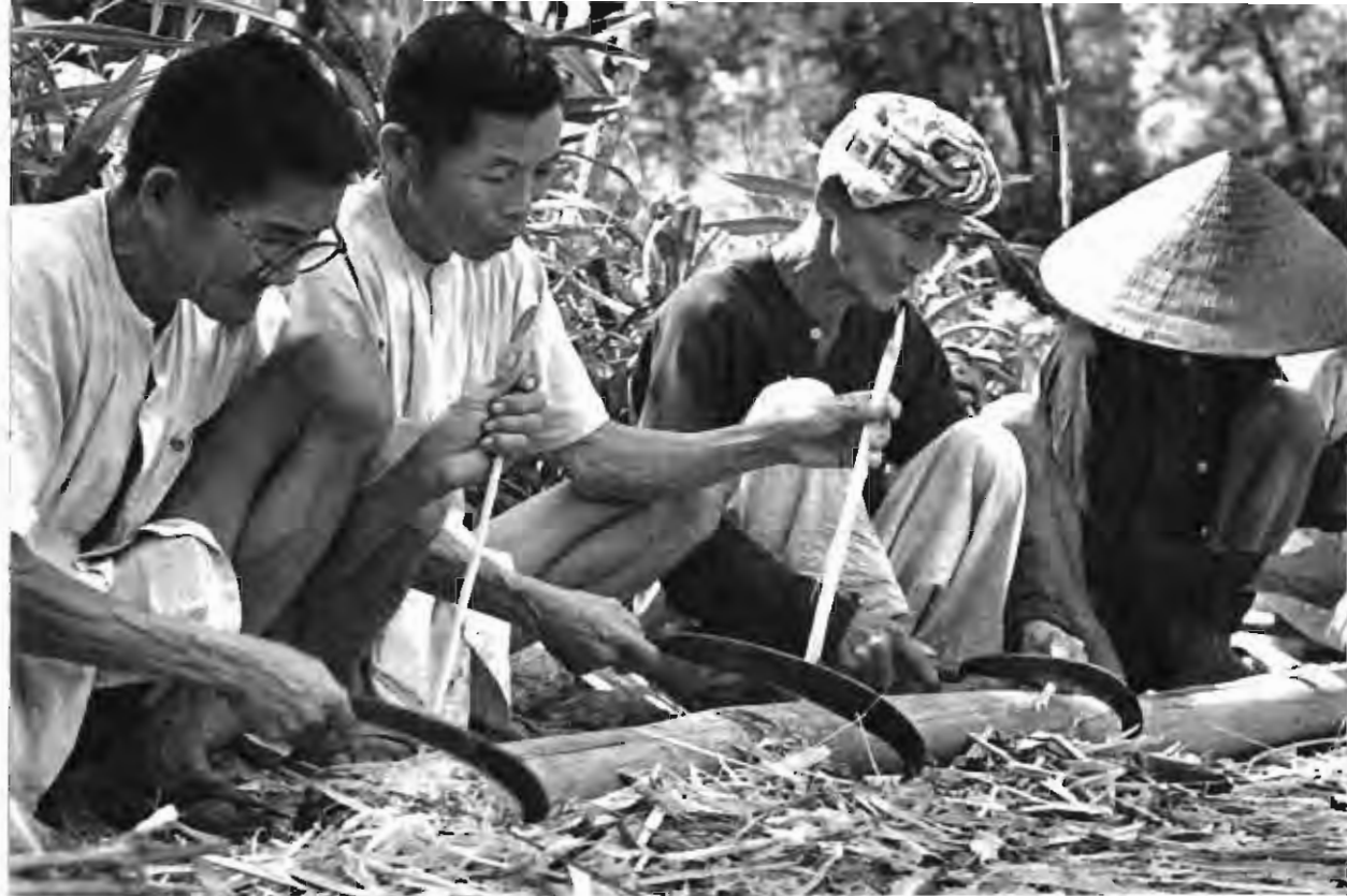
抗美援朝，人人爭先。 图为解放区的老年人在 削制竹桩