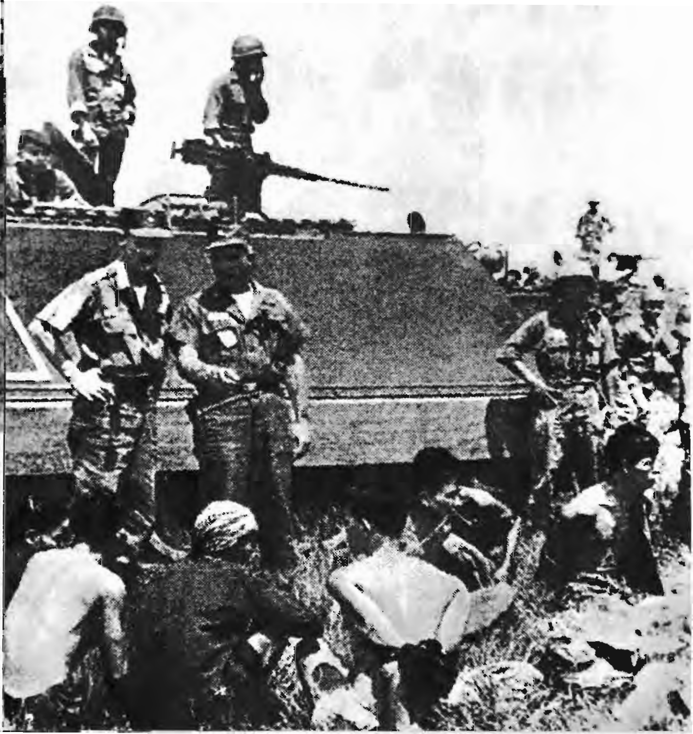
大批逮捕手无寸铁的村民