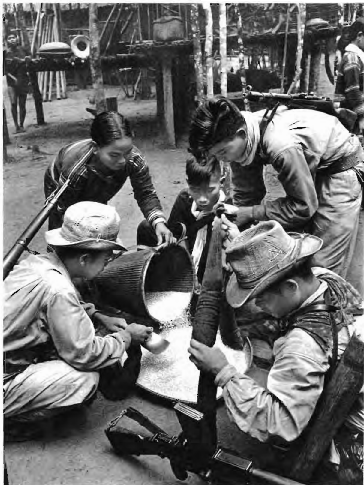
解放区人民把节约下来的粮食送给人民子弟兵