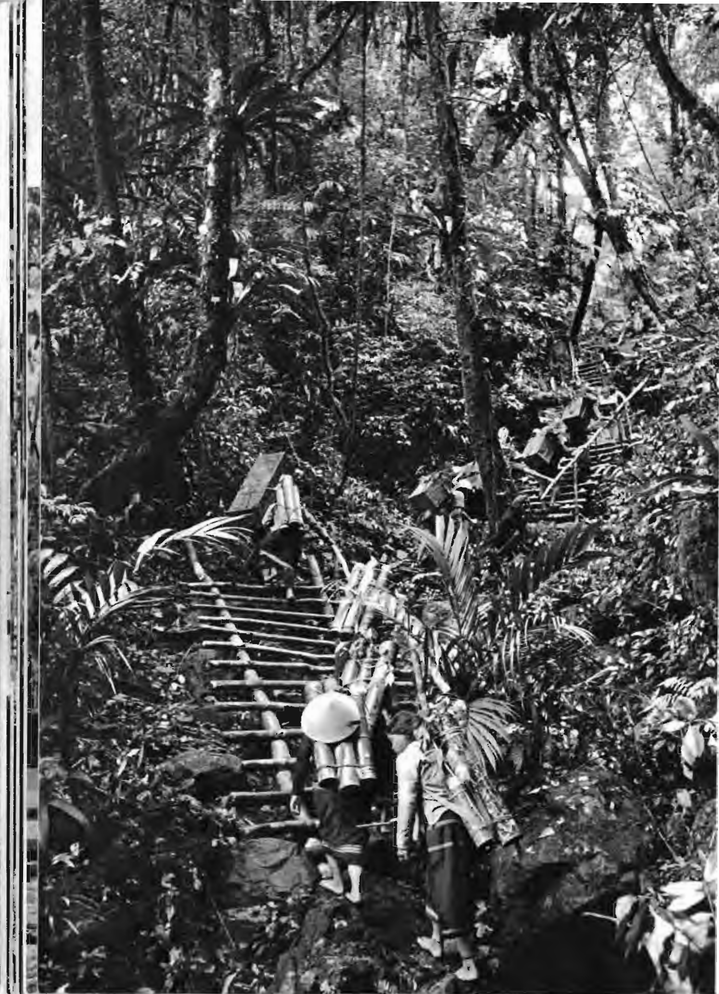
后方群众不怕山高路远，积极支援前方