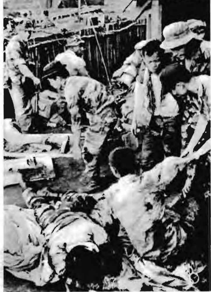
一九六五年十月十九日，解放军奇襲波來梅美伪特种部队兵营，歼敌近两营，并痛击了前往救援的美国第一騎兵师。图为波來梅兵营敌军死伤情况