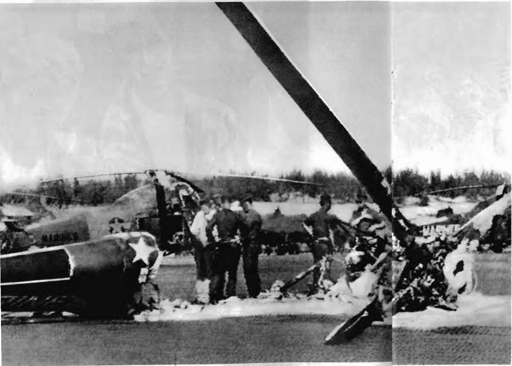
一九六五年十月二十七日夜，越南南方解放军奇襲岷港和朱萊美軍机场，毀伤美机八十架，毙伤美軍二百多人。图为被击后的岷港机场