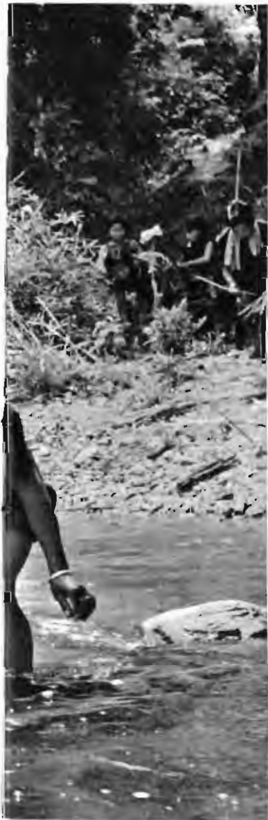
妇女在村头一面織补魚网，一面放哨守卫