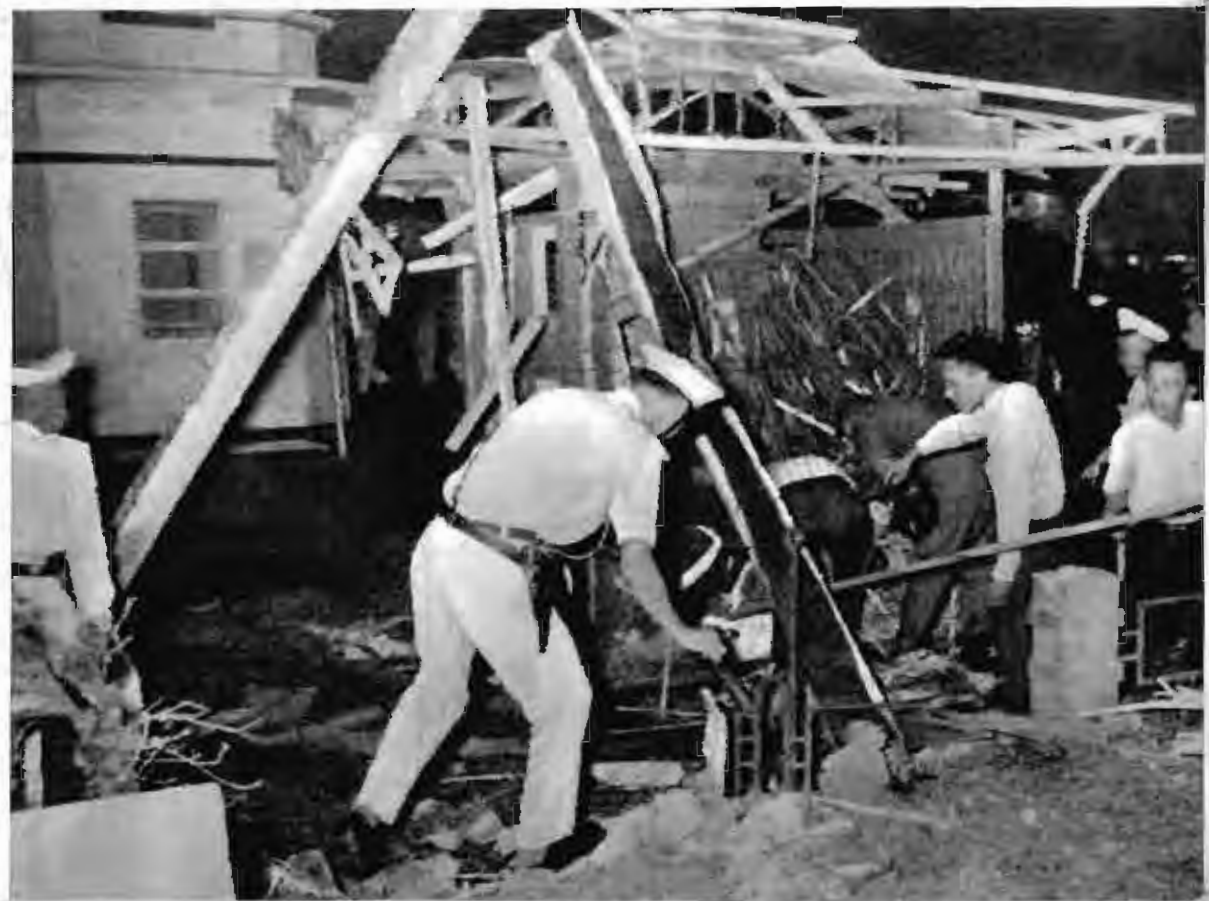
一九六六年一月八日，人民武装再次爆炸西貢河上美軍“美景”餐厅。图为爆炸后的餐厅