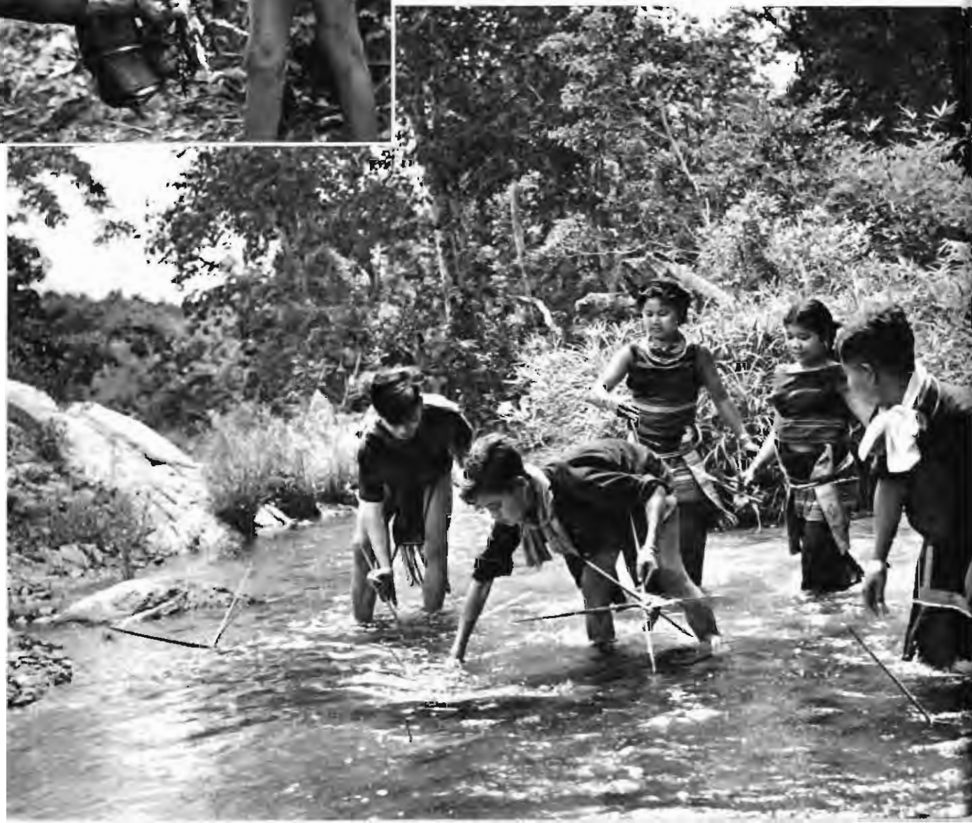
少数民族青年在河道里暗伏竹桩