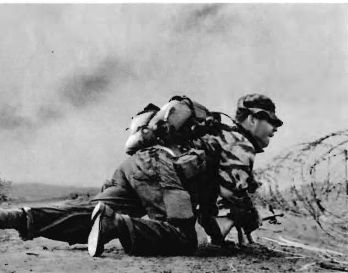
在越南南方人民武装力量的炮火面前，美国强盗胆小怕死，不敢移动一步

越南南方軍民創造性地运用和发展了人民战争的战略战术，把人民战争提高到了一个新的水平。他们发挥自己的长处，利用敌人的短处，抓住一切有利战机，大量消灭敌人的有生力量。美国侵略者陷在人民战争的汪洋大海里，被动挨打，寸步难行。美帝国主义的节节失败再次证明：它不过是一只外强中干的纸老虎。