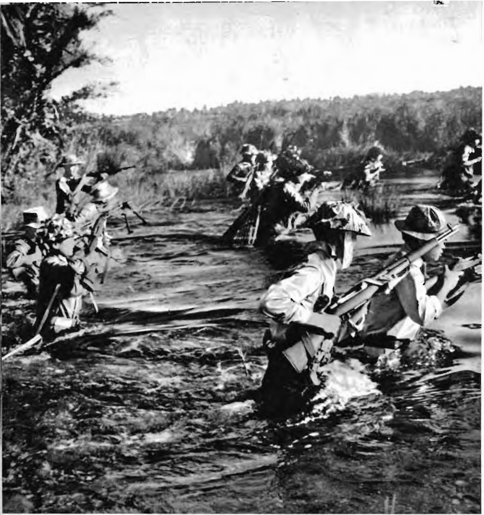
渡河追击，不让敌人有一分钟喘息时间