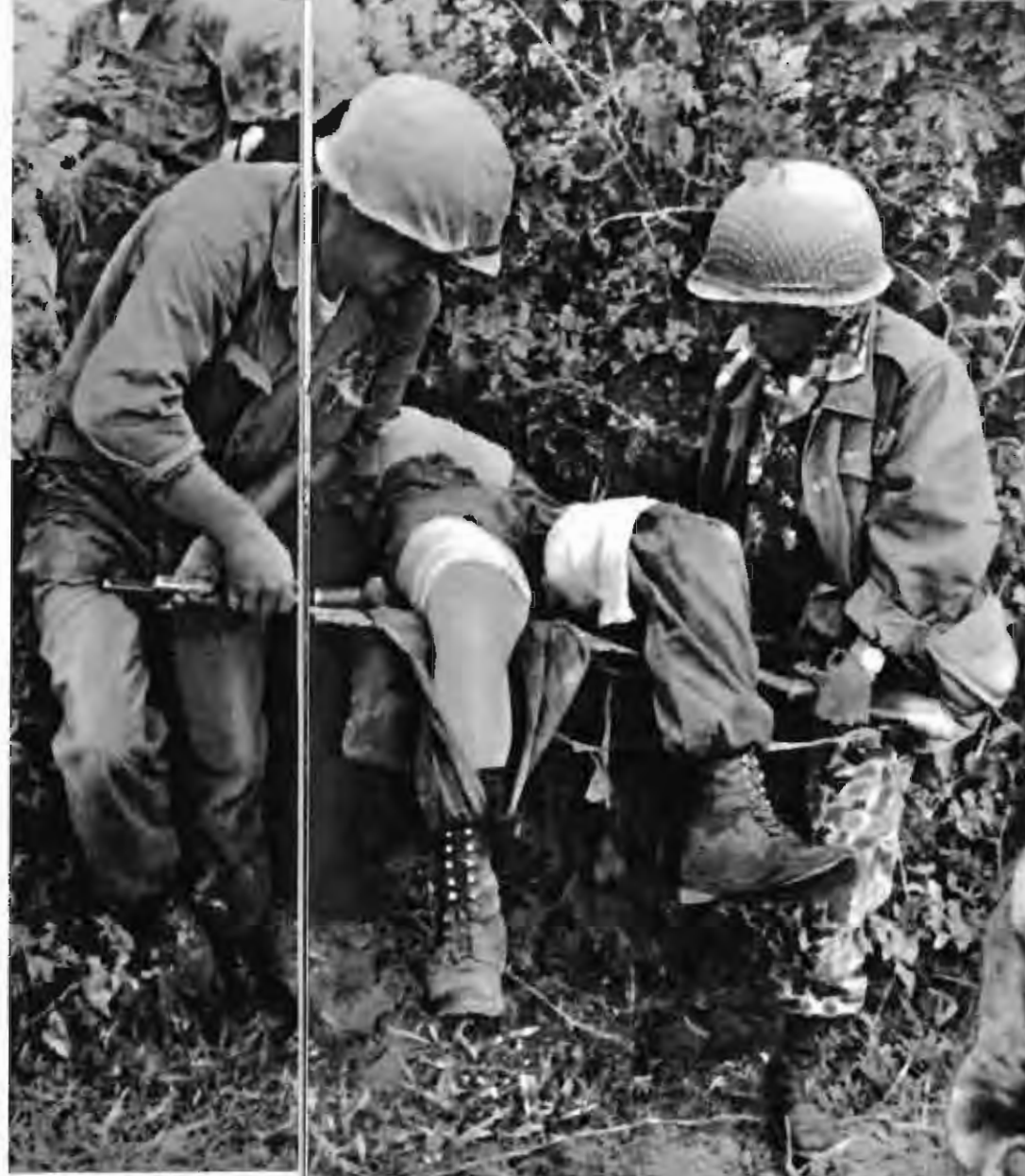
拖死带伤，撤出丛林