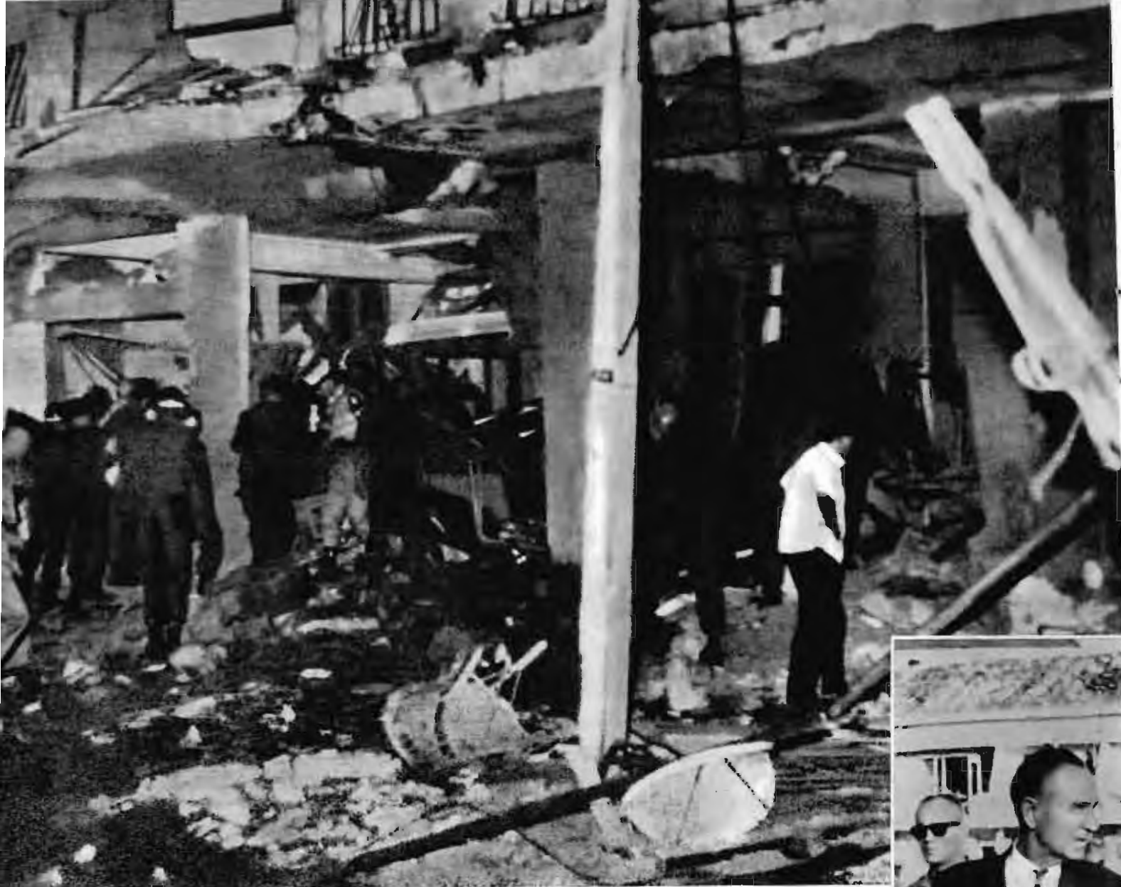
一九六五年十二月四日，炸毀西貢美軍宿舍，斃傷美國噴氣式飛機駕駛員二百多人。圖為炸毀的美軍宿舍