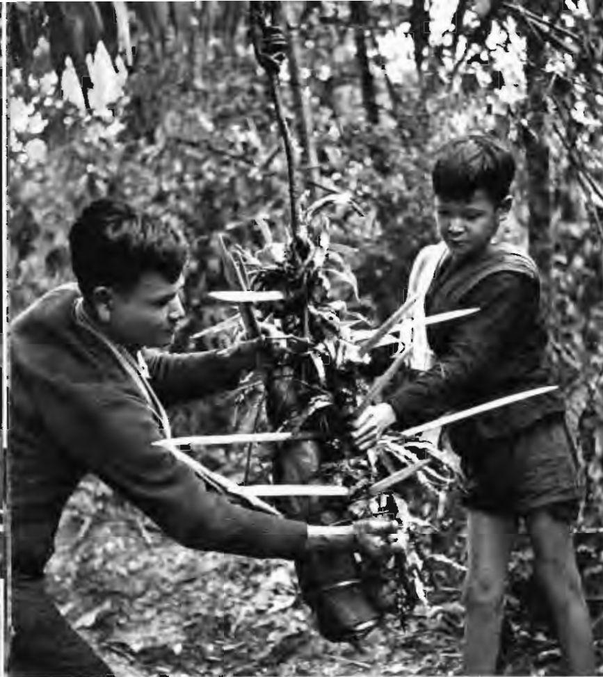
在丛林路旁的树上吊上竹桩， 出其不意地打击来犯之敌