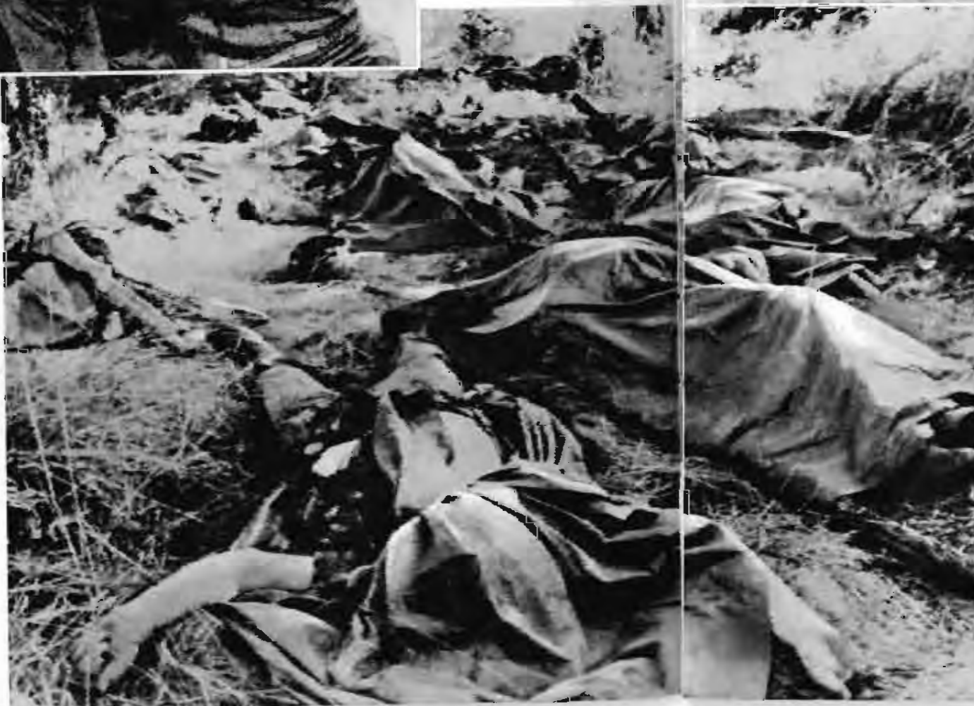
美軍尸体狼藉的德浪河谷战场