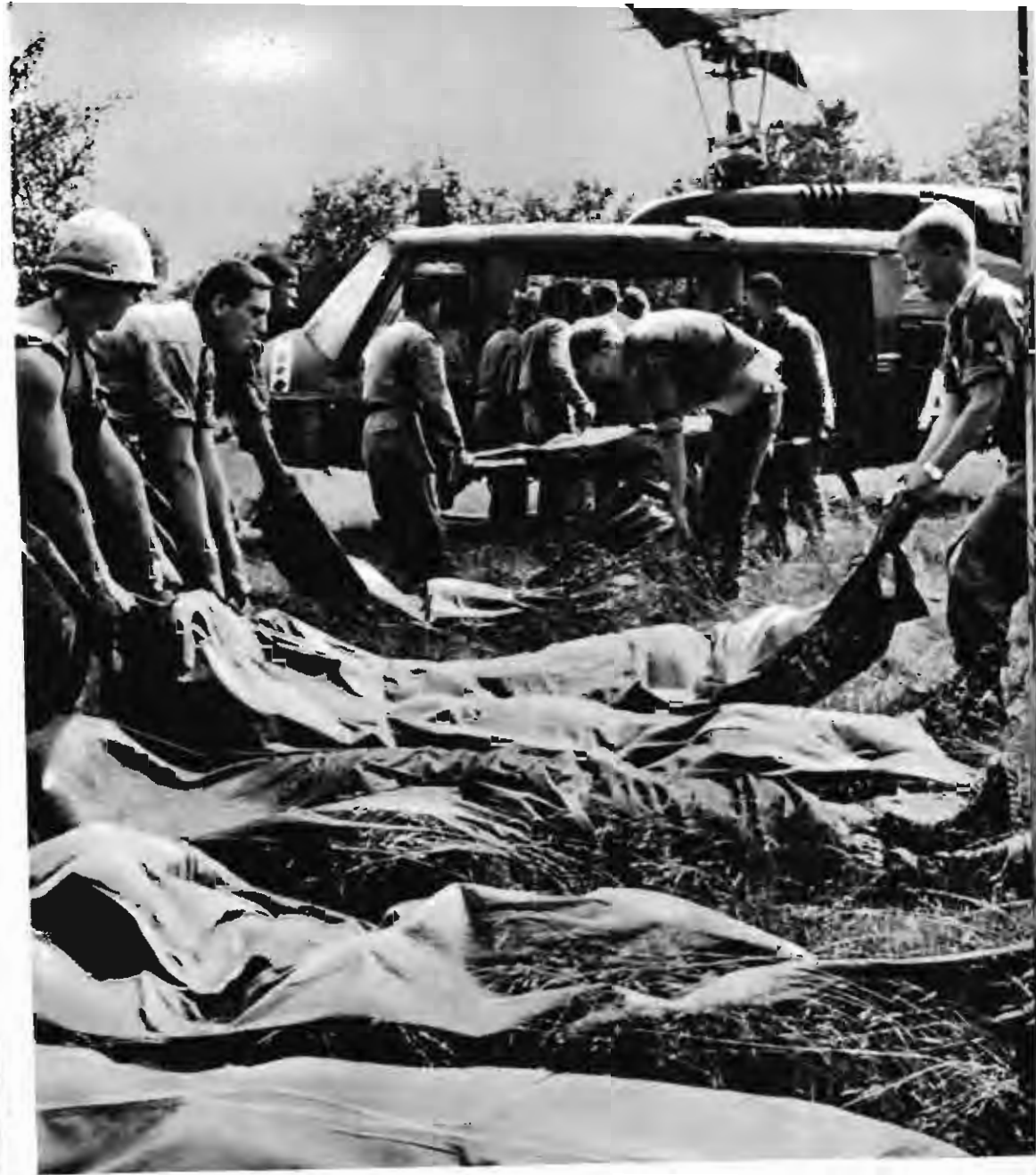
一九六五年十二月五日，在西貢西北約五十六公里的地方，痛擊美國第一騎兵師。圖為美軍在搬運屍體