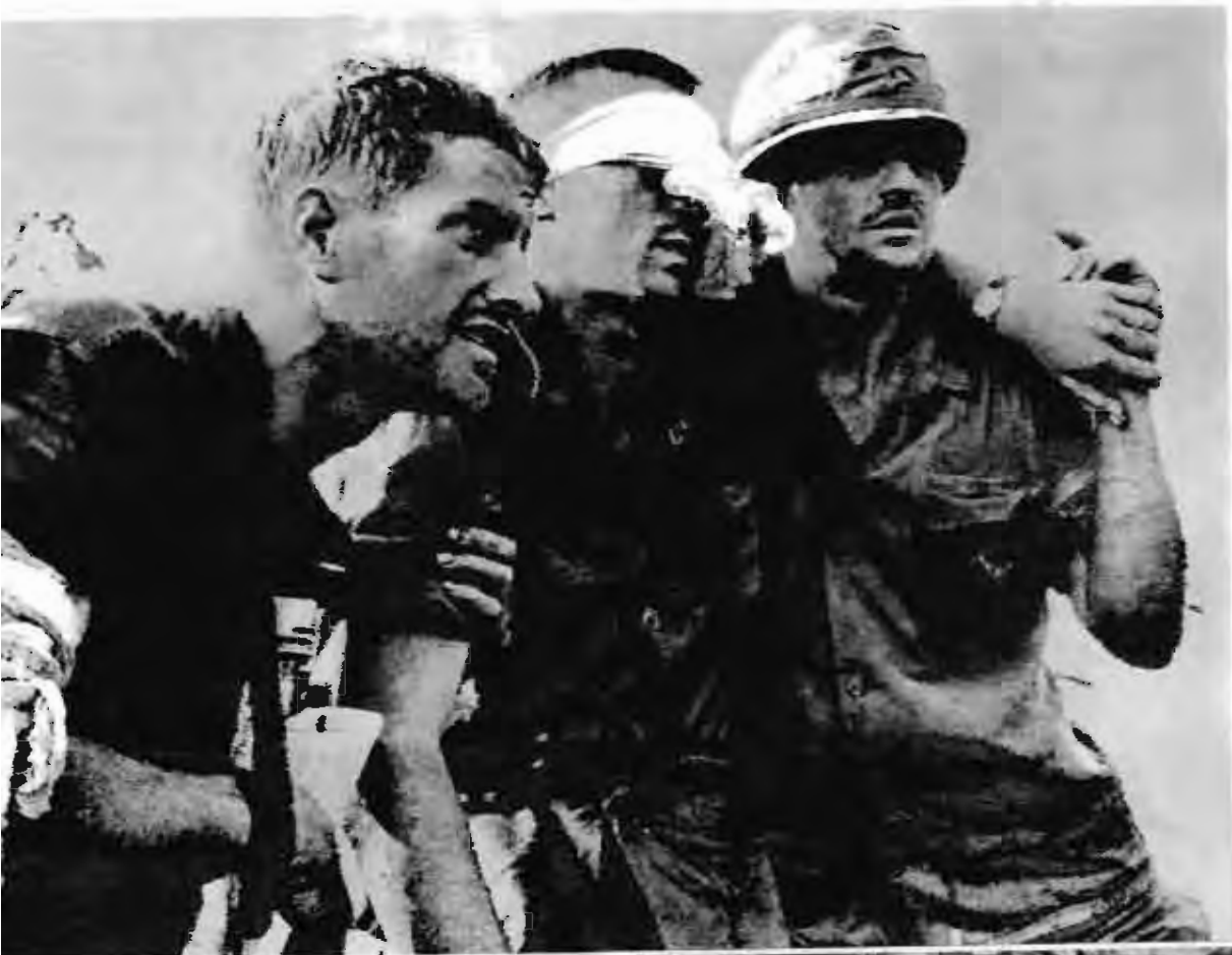
一九六五年十一月一日至十九日，在波来梅地区的朱邦山和德浪河谷歼灭美軍一千七百多人，击落击伤美机三十一架。图为狼狈逃窜的美国侵略軍