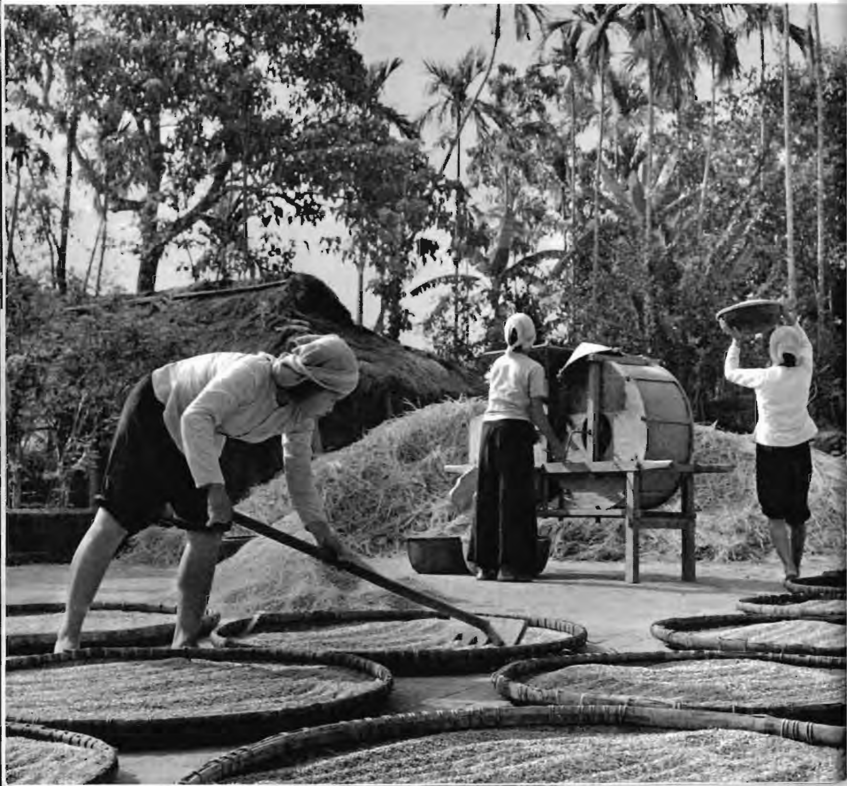
解放区农民加紧生产，支援前线