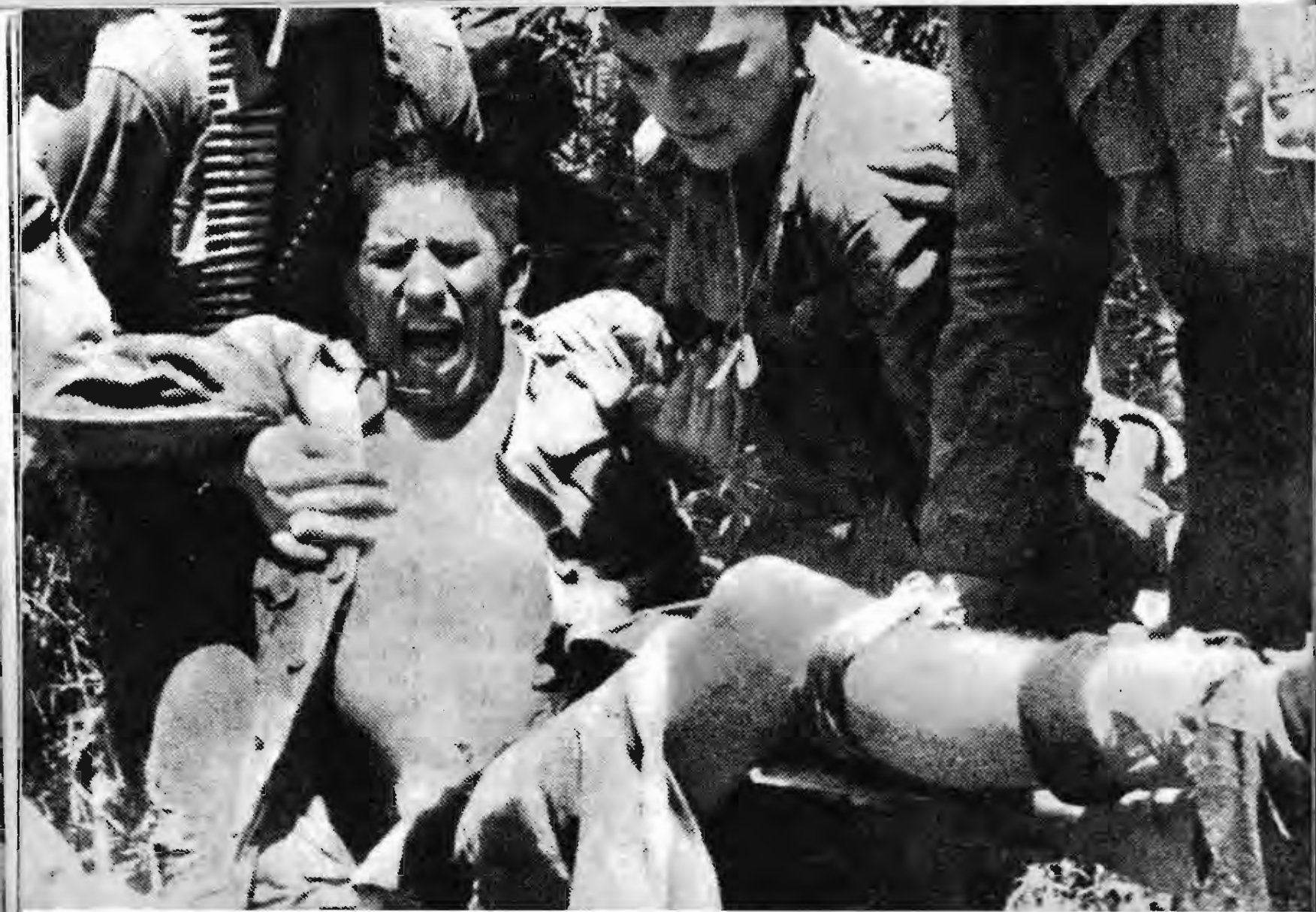
中了地雷，鬼哭狼嚎