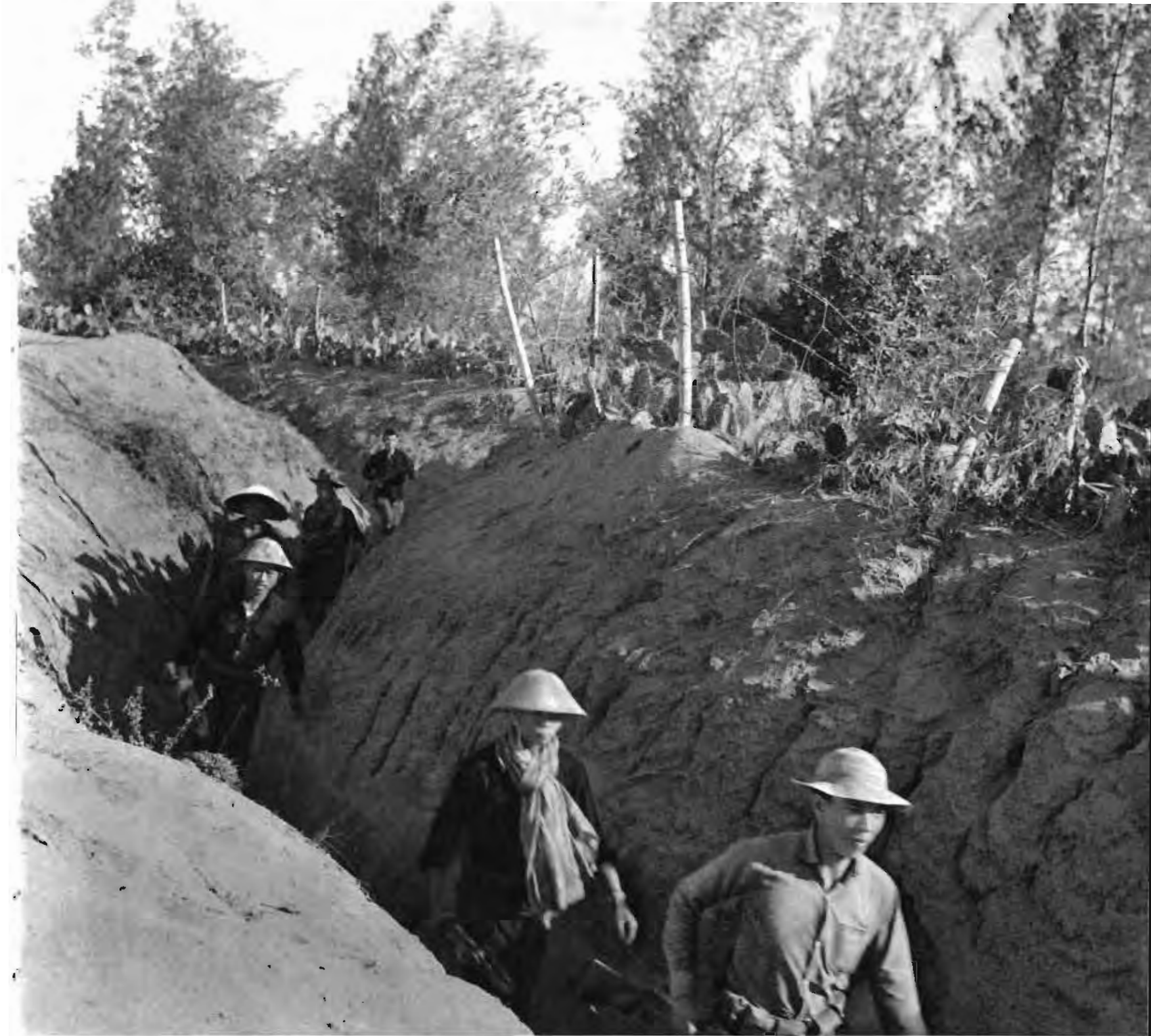
解放区人民随时警惕着敌人的进犯。图为某村游击战士在村子周围的壕沟里巡逻