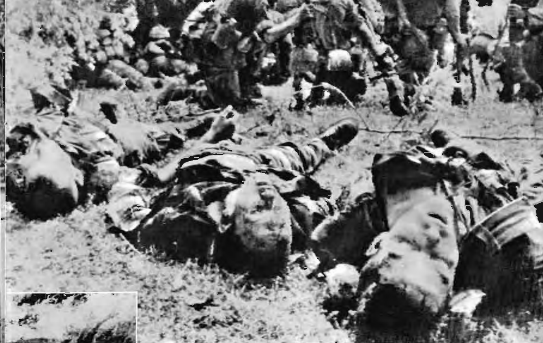
一九六五年九月十八、十九日，解放軍在安溪地区发挥近战本领，痛歼美国空降师二百多人，击落美国飞机十架。这是被击毙的侵略軍