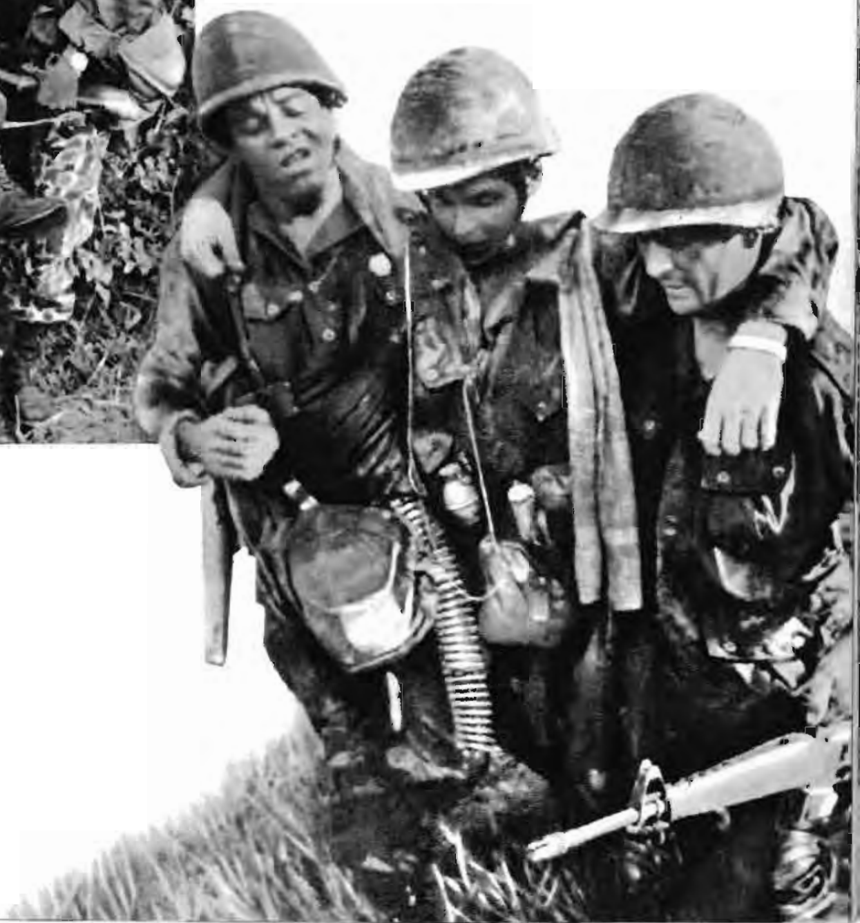
“扫荡”扑空遭痛击，沼泽地里难逃命