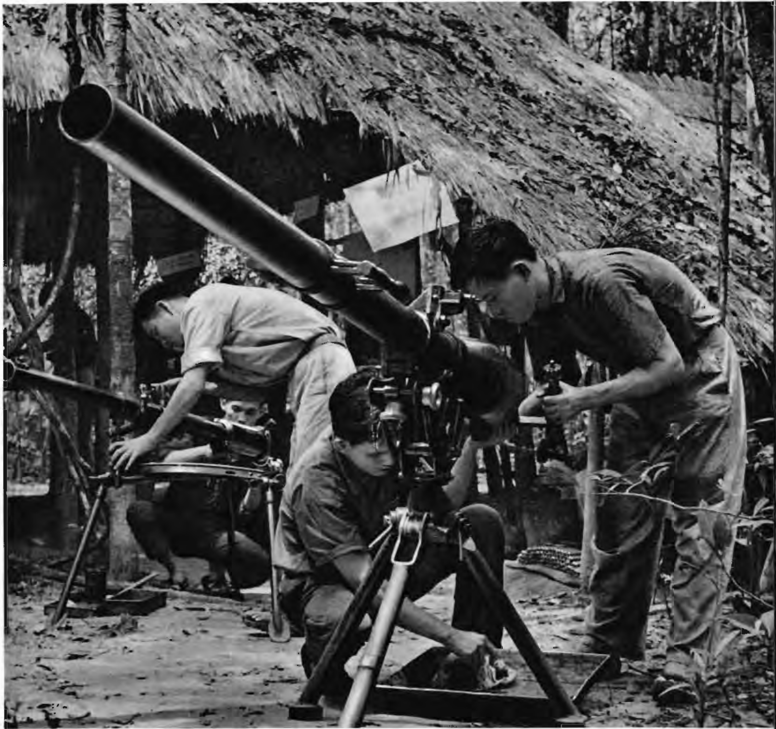
发扬自力更生精神，自己动手制造武器。图为解放区某地兵工厂一角