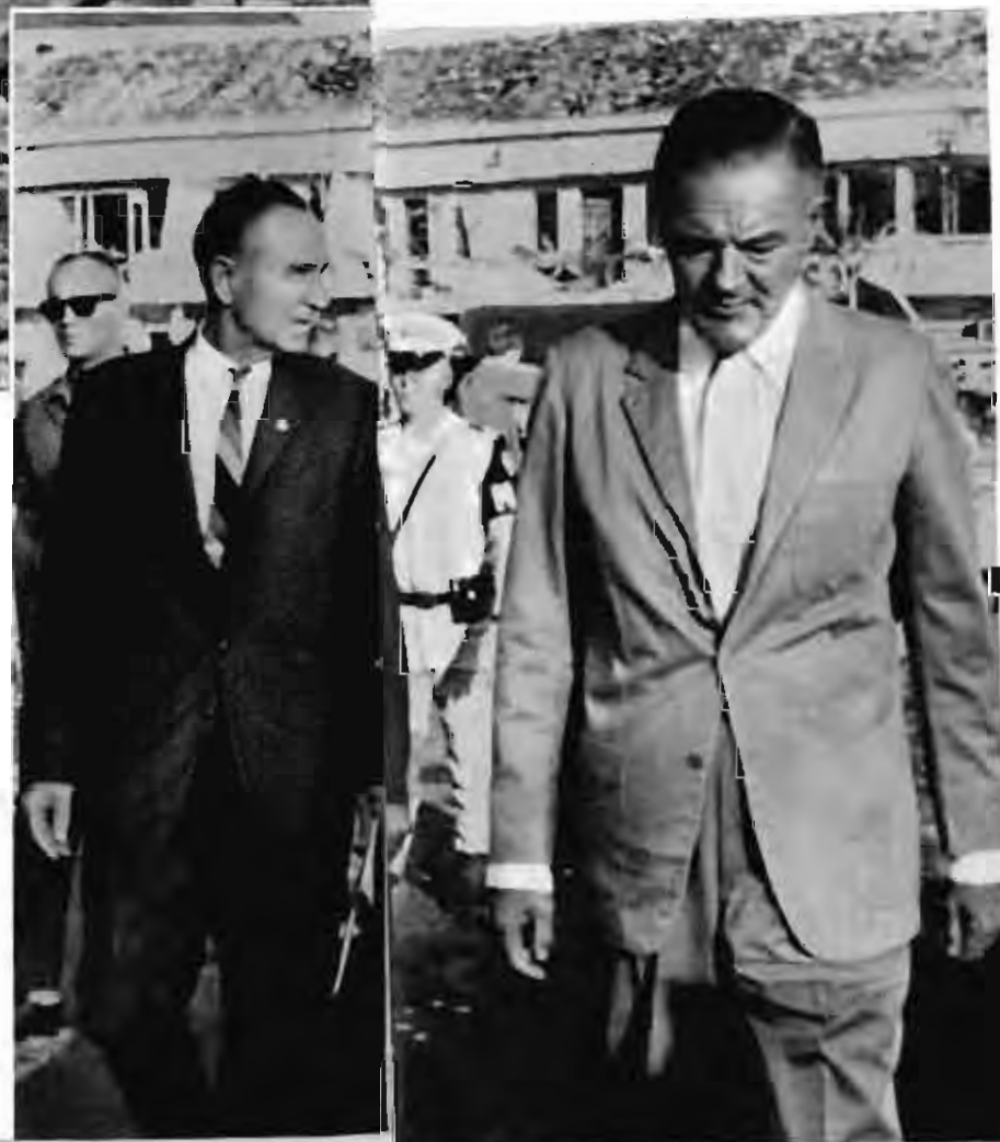
美國參議員曼斯菲爾德（左）和美國駐西貢“大使”洛奇，愁眉苦臉地趕到被炸毀的美軍宿舍現場