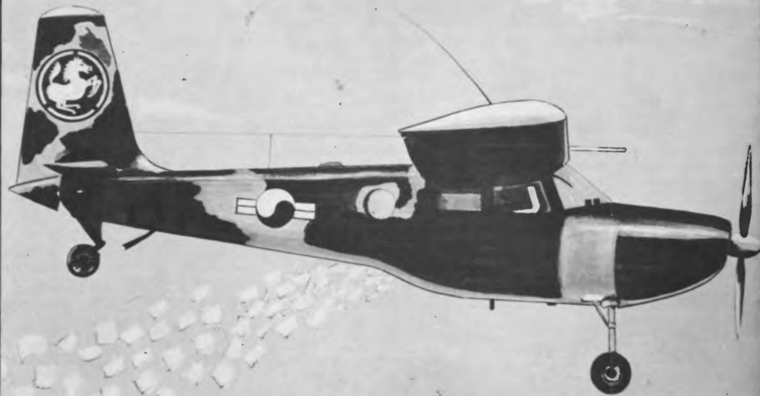
주월한국군 팜푸렐 1968. 12 월