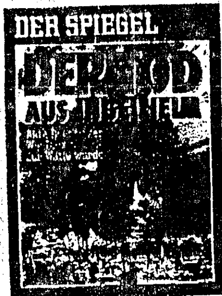
SPiegel-Titel 31/1991 Seltsame Allianz

Erst eine undichte Hamburger Müllbake ließ 1984 die erschrockene Öffentlichkeit das Boehringer-Gift entdecken. Und erst acht Jahre später stellt sich das Chemieunternehmen aus seiner Verant-